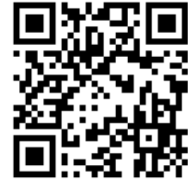
Единый календарь образовательных событий Минпросвещения России

Среди организаторов событий, размещенных в календаре, педагогические вузы Минпросвещения России, Московский государственный университет имени М.В. Ломоносова, АНО «АПГИ» и другие организации.