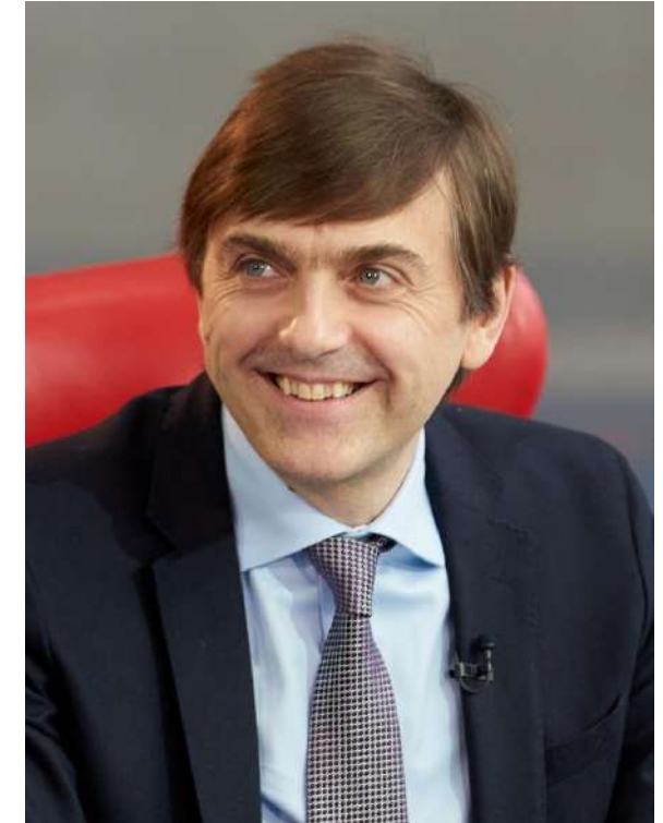
Министр просвещения РФ Сергей Кравцов

Следующее направление – современная инфраструктура, созданная в том числе в рамках национального проекта «Образование». Строятся и ремонтируются школы и детские сады, в также открыты 79 региональных центров, работающих по модели «Сириус», открыто более 250 центров «IT-куб», 365 технопарков-кванториумов, а также более 17 тысяч центров образования цифрового, естественнонаучного, технического, гуманитарного профиля «Точки роста».