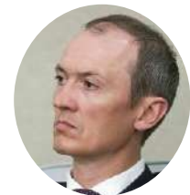
Вице-премьер РФ — руководителя аппарата Правительства Дмитрий Григоренко

Ранее из-за отсутствия финансирования школы и другие бюджетные учреждения могли «не соблюдать какие-то правила», а потом в рамках проверок надзорные государственные органы «наказывали самих себя, вынося штрафы» Это выглядело странно. Мы решили эту задачу, как обещали, у нас на сегодняшний день такие проверки запрещены, это все переведено в режим профилактики, которая запрещает штрафовать, но при этом дает рекомендации на предмет выявления нарушений и исправления, если такие есть