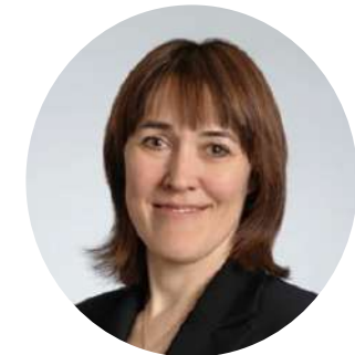
Замглавы Минобрнауки России Петрова О.В.

Реализуемая система федеральных инновационных площадок Минобрнауки России сегодня оказывает всестороннюю поддержку педагогическому сообществу – реализуемая инновационная площадка выступает организатором профессиональных конкурсов и мероприятий, разрабатывает педагогические учебники и пособия, оказывает информационную, правовую, методическую и информационную поддержку работникам образования и реализует и иные важные задачи в системе образования.