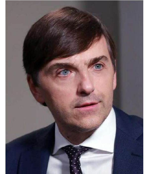
Министр просвещения РФ Сергей Кравцов